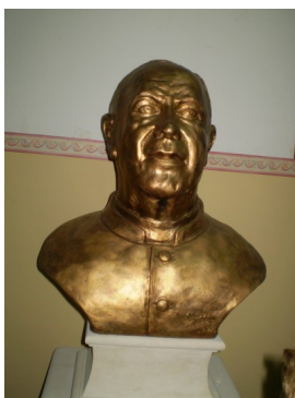
Busto don Giacomo Pantaleo

Nuova dignità alla biblioteca comunale «Don Giacomo Pantaleo».