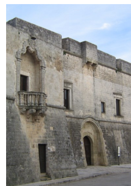
Il Castello di Andrano

E a breve, sempre al piano terreno dell'antico edificio, sarà inaugurata anche la Bio-caffetteria, all'interno della quale incontri, condivisione, promozione del territorio e dei prodotti tipici sapranno conquistare l'attenzione del viaggiatore e del turista che si fermerà a visitare e a respirare la storia del nostro Gigante.