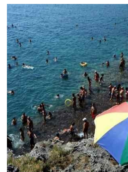
Marina di Andrano