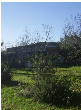
Il lascito Carrozzo

Partiranno a breve i lavori per fare del Lascito Carrozzo un centro socio educativo diurno per minori.