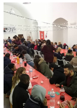
Un momento della cena

migranti ospiti di Andrano. Dopo i saluti istituzionali del primo cittadino e l'intervento di Andrea Pignataro, membro del consiglio direttivo del Gruppo Umana Solidarietà, è stata la volta del noto attore e autore Andrea Rivera e del suo spettacolo. A conclusione della serata, è arrivata una cena conviviale e l'immancabile tombolata natalizia. Momenti semplici e di autentico calore umano, dimostrazione pratica che l'integrazione è un risultato complesso da raggiungere, ma capace di arricchire una volta realizzato.