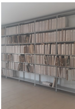
L'Archivio storico comunale

«Un popolo senza la conoscenza della propria storia, origine e cultura, è come un albero senza radici».