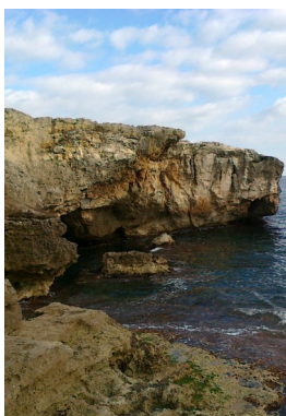
La Grotta Verde