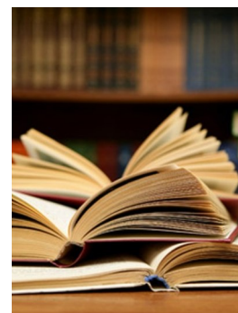
La biblioteca fonte di cultura

disponibile diverrà un laboratorio musicale dove ascoltare e «fare» musica. Al piano terra, un laboratorio educativo –didattico per i bambini permetterà al gestore che si aggiudicherà l'intero «pacchetto» di sostenere il progetto. Il quale prevede interventi di restyling sull'edificio per 200 mila euro e il resto da investire tutto in forniture. Un grande risultato quello centrato dall'Amministrazione Comunale: un progetto che nasce dal basso, prodotto e condiviso con il mondo della scuola e con l'associazionismo locale. Un disegno di futuro che dopo avere conquistato la commissione giudicatrice della Regione darà una spinta ulteriore alla crescita culturale e civile del paese.