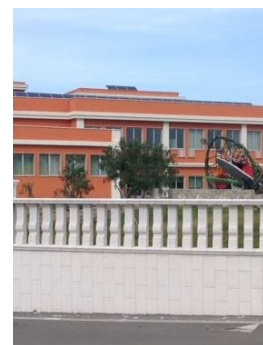
La scuola di via Del Mare

scolastiche. In quest'ultimo elenco, rientrano dieci lavagne interattive con altoparlanti integrati, complete di computer portatile e relativa cassetta di sicurezza, un videoproiettore a raggio corto e due video ingranditori per alunni ipovedenti, un paio di stampanti multifunzioni wifi a colori e altrettante plastificatrici, arredamento vario, materiale e attrezzature utili nelle ore di Educazione fisica di studenti e scolari. Si provvederà all'oscuramento con appositi tendaggi dell'aula magna dell'istituto di via Del Mare, che sarà dotata anche di un moderno impianto di amplificazione e diffusione attraverso l'utilizzo di cinque microfoni senza fili e ad archetto e di nuovo arredamento.