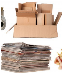
Differenziare i rifiuti conviene

«Vola» la raccolta differenziata sul territorio comunale.